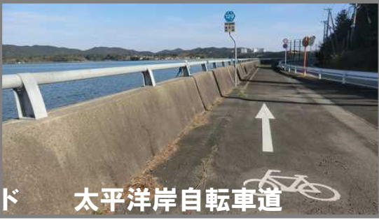
太平洋岸自転車道