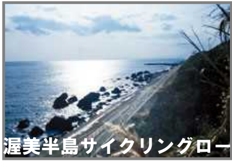
渥美半島サイクリングロード

参加費には、現地迄の往復のバス及びフェリー等の交通機関代・1泊2食付宿泊代・現地迄の自転車搬送料及びサポート料・初~中級者の希望による先導料・etcが含まれます。