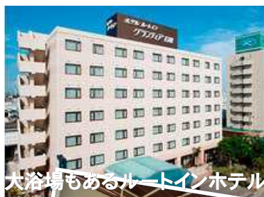
大浴場もあるルートインホテル