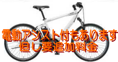
電動アシスト付もあります 但し要追加料金