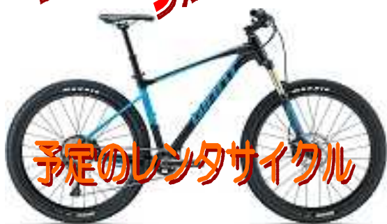
予定のレンタサイクル